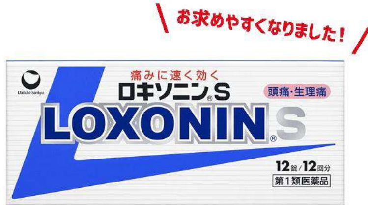
ロキソニンS -ロキソプロフェン- (第1類医薬品)