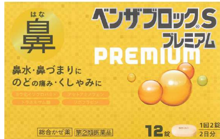
ベンザブロックSプレミアム -d-クロルフェニラミンマレイン酸塩- (第2類医薬品)