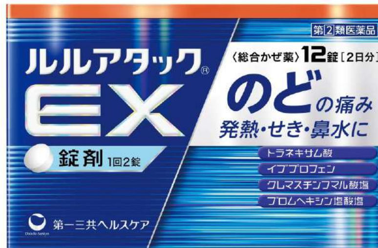
ルルアタックEX -トラネキサム酸- (指定第2類医薬品)