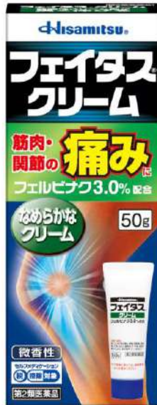
フェイタスクリーム -フェルビナク- (第2類医薬品)