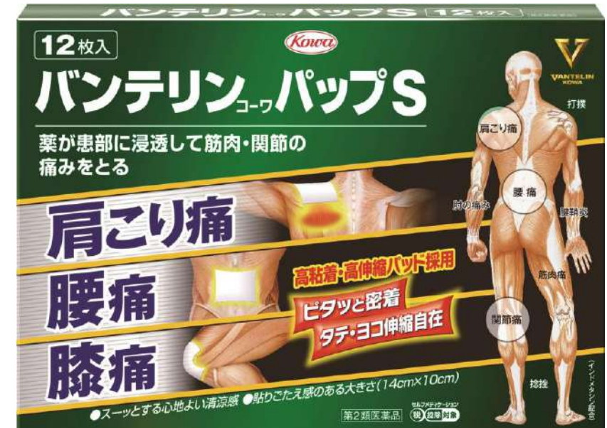
バンテリンパップS -インドメタシン- (第2類医薬品)