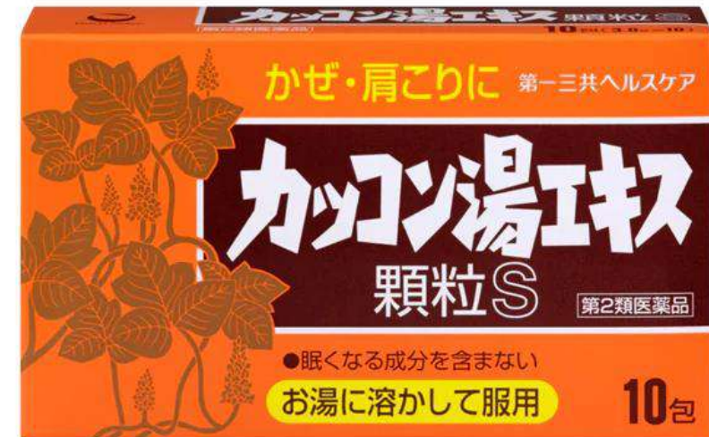
カッコン湯エキス (第2類医薬品) かぜのひきはじめに