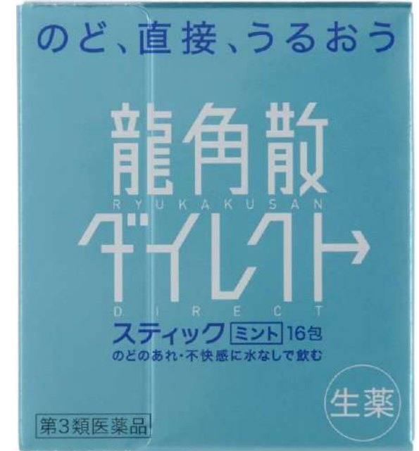
龍角散ダイレクト -甘草- (第3類医薬品)