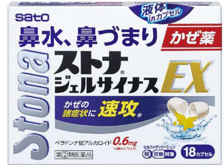
ストナジェルサイナスEX -ペラドンナ総アルカロイド- -ジフェニルピラリン塩酸塩- (第2類医薬品)