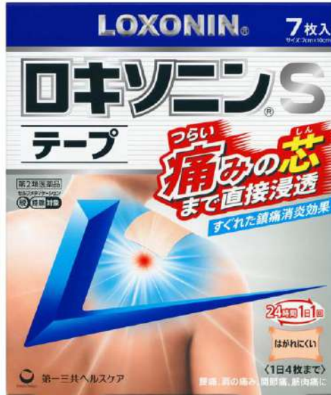
ロキソニンSテープ -ロキソプロフェン- (第2類医薬品)