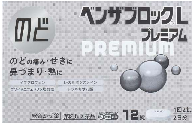
ベンザブロックL -トラネキサム酸- (指定第2類医薬品)