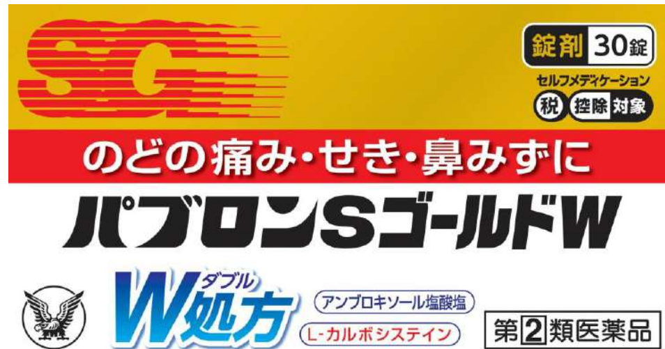
パブロンSゴールドW (指定第2類医薬品)

発熱や鼻水・鼻づまり、喉の痛み、咳などの風邪の諸症状が出た場合に備えておくとも便利なのが、 総合風邪薬 です。常備してとけば、幅広い症状に対応ができます。