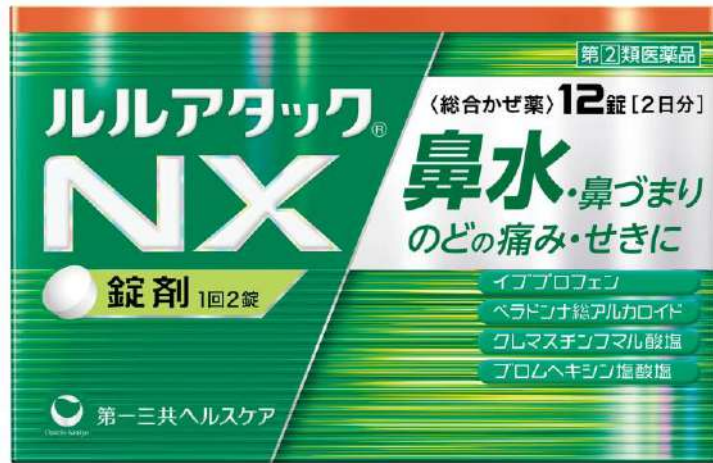
ルルアタックNX -クレマチンフマル酸- -ペラドンナ総アルカロイド- (指定第2類医薬品)