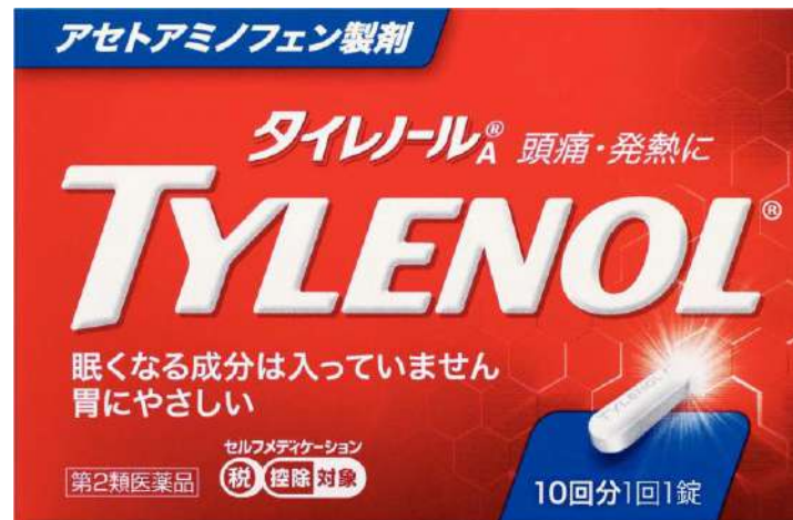
タイレノールA -アセトアミノフェン- (第2類医薬品)