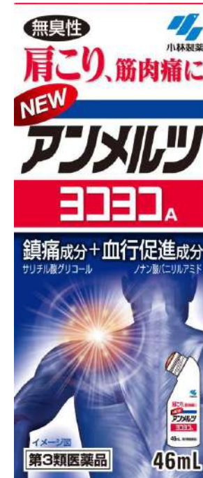
ニューアンメルツヨコヨコA -サリチル酸グリコール- (第3類医薬品)