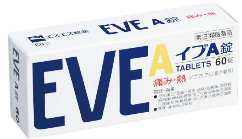
イブA錠 -イブプロフェン- (第2類医薬品)