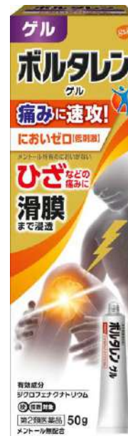
ボルタレンACゲル -ジクロフェナクナトリウム- (第2類医薬品)