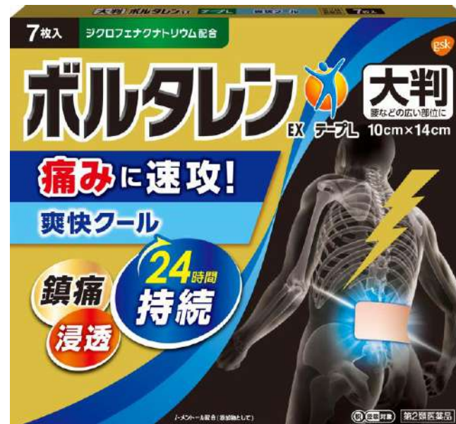
ボルタレンEXテープL -ジクロフェナクナトリウム- (第2類医薬品)